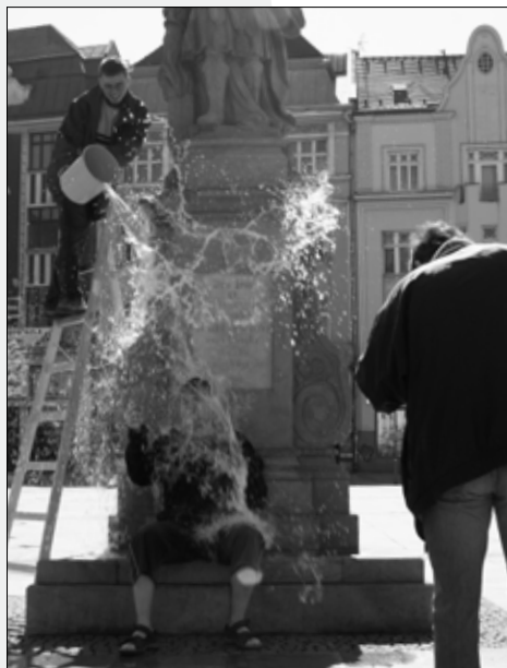
▲ Rubrika Světec představuje netradičním způsobem svaté církevního roku. Snímek je z natáčení svatého Floriána – patrona hasičů.